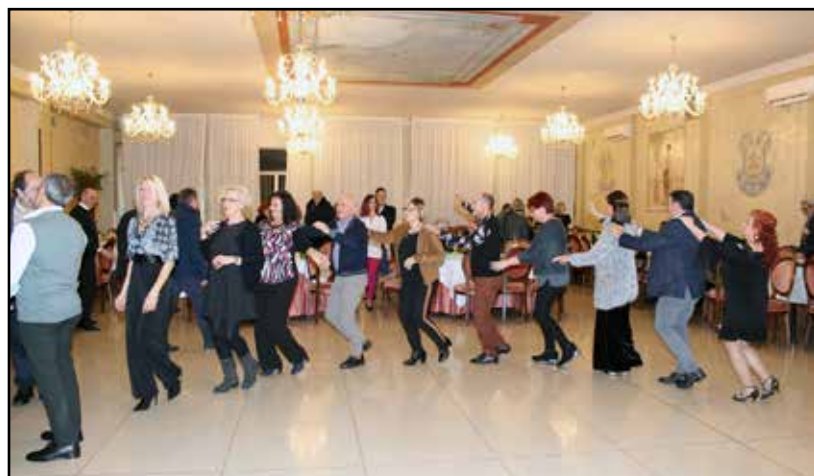
Il classico trenino finale.

Ballo, lotteria, cena dall'aperitivo al dolce finale sono stati gli ingredienti per la riuscita di una edizione sicuramente fra le più riuscite a detta dei presenti che hanno ringraziato per