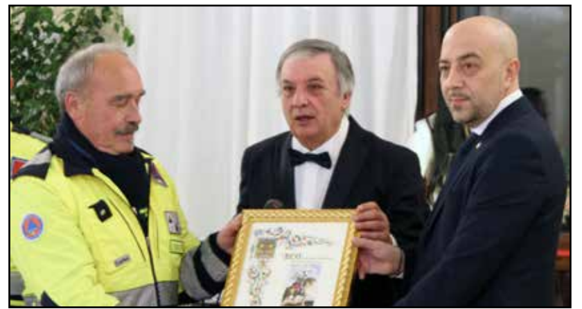
Il premio alla Protezione Civile.