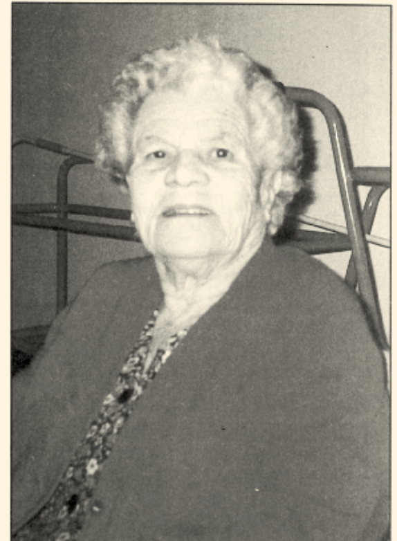
La signora Erminia, attualmente ospite della Casa Albergo di Montichiari, protagonista della vicenda qui rievocata con tanto realismo condito di schietta e autentica umanità.

La mia fanciullezza fu in gran parte una sfilza di miserie; l'episodio della gamba di legno di Mussolini riesce a mitigare i dolorosi ricordi, e mi è di grande consolazione il ripassarne i diversi momenti.