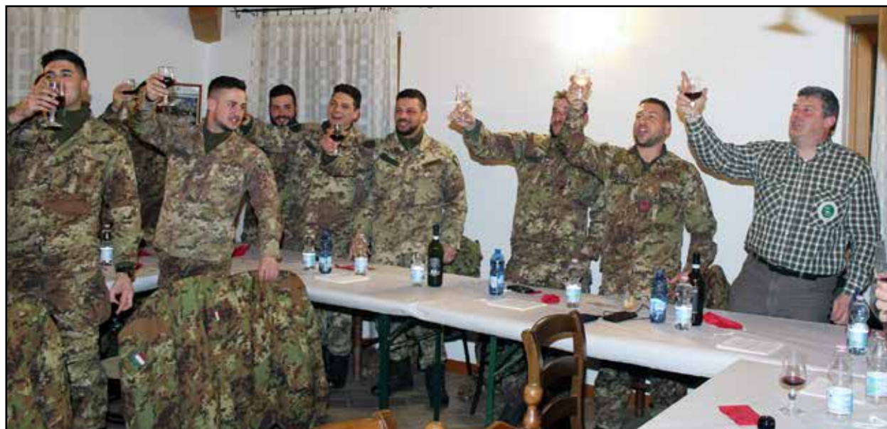
Il cin cin finale dei militari Alpini presenti alla cena.