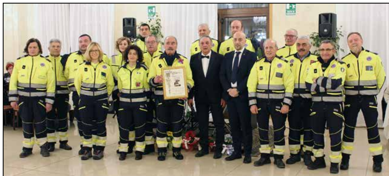
Il Premio San Pancrazio al Gruppo Volontari Protezione Civile alla presenza del Sindaco Togni e dell'Editore Mor.

sia in caso di calamità sia nelle numerose manifestazioni organizzate sul territorio".